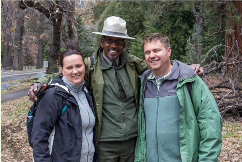
NP Yosemite, 2017.